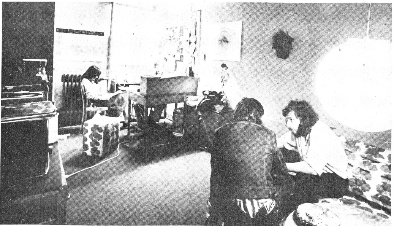
Mitten in der Stadt - in Tuchfühlung mit Jugendlichen und Ihren Problemen - befindet sich das Drop-in.

Das Drop-in befindet sich inmitten der Stadt - in enger Tuchfühlung mit Jugendlichen und ihren Problemen. Zum Arbeitsbereich des Drop-in gehören Arbeits- und Wohnungsvermittlungen, vor allem aber die Durchführung verschiedener ambulanter Therapien. Durchschnittlich werden pro Monat etwa vierzig Personen ambulant-therapeutisch behandelt, die Dauer der Betreuung schwankt zwischen einigen Wochen und mehr als einem Jahr.