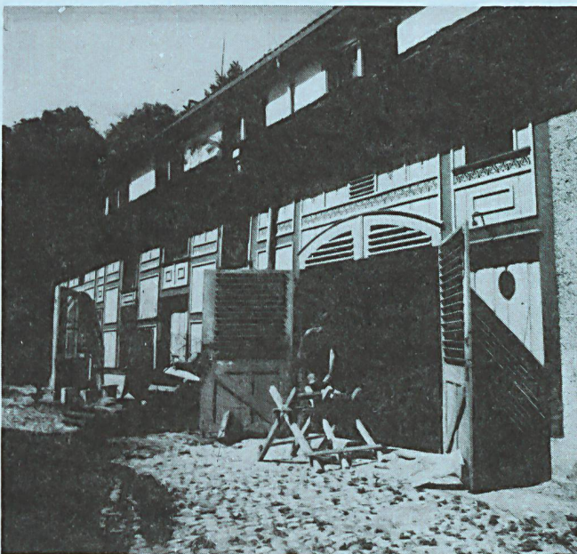
Stiftung Alg Neuthal in Bäretswil

Wenn man das so hört und liest, könnte man meinen, es sei gar nicht so viel Neues gefunden worden, Therapeuten und Diskussionsteilnehmer haben ja schon