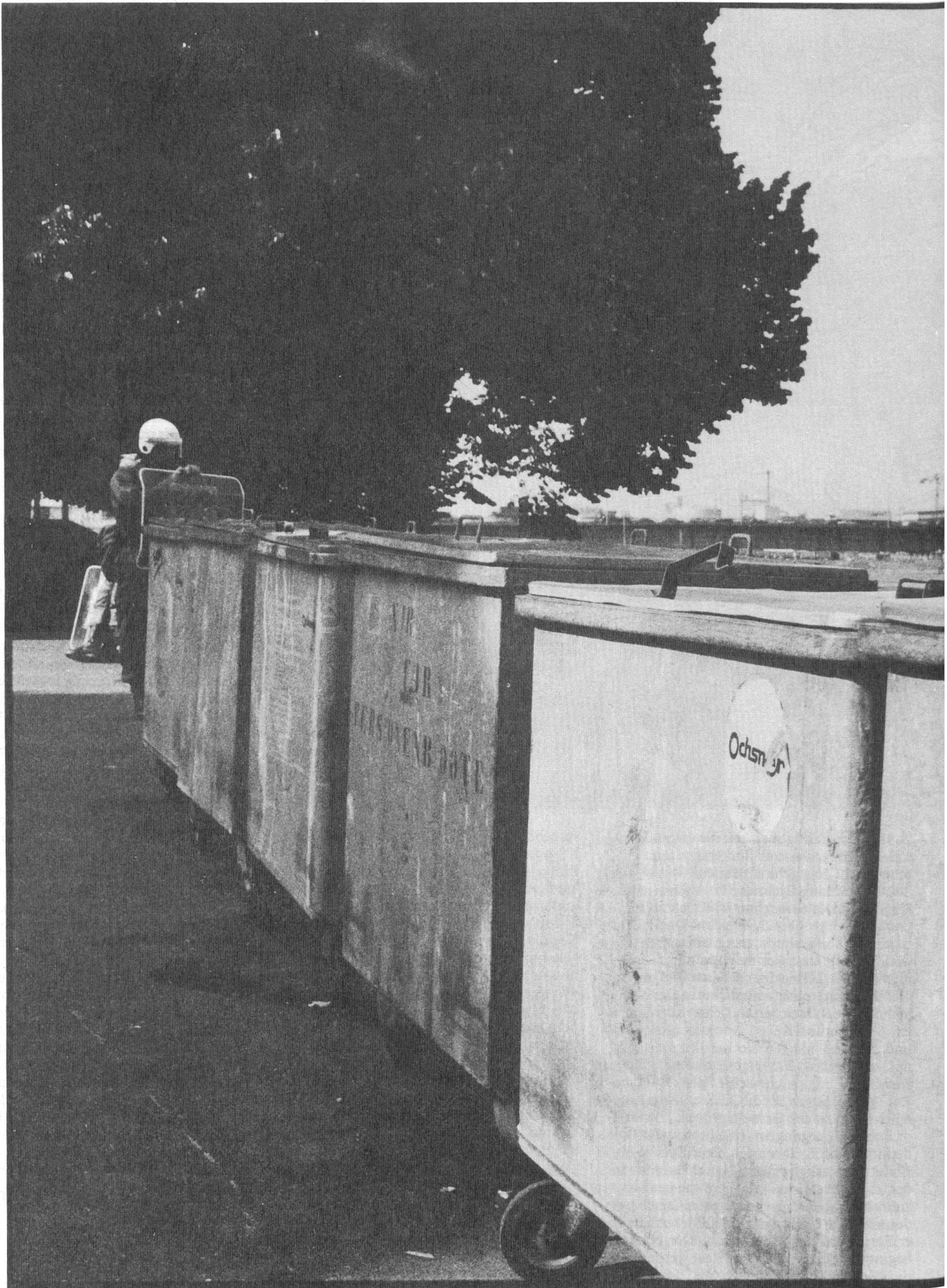
Basel, Juni 1988.