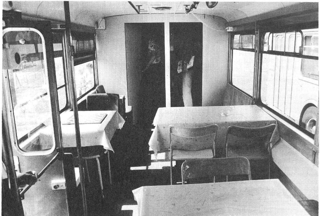
Blick in einen Zürcher-Drogen-Bus.

Nachdem die in Zürich geplanten dezentralen Anlaufstellen für Drogenabhängige auf massiven Widerstand in den betroffenen Quartieren gestossen sind und es in der Folge zu Rekursen gegen die Baueingaben für die vorgesehenen Baracken gekommen ist, hat sich die Betriebsaufnahme dieser Projekte bisher verzögert. Nun hat das Zürcher Sozialamt eine listige Lösung gefunden: um nicht warten zu müssen, bis die Standortfragen definitiv geregelt sind, haben mobile Anlaufstellen zu Beginn des Monats August ihren Betrieb aufgenommen. Seither dienen drei von den Zürcher Verkehrsbetrieben ausrangierte, grün gespritzte und umgebaute