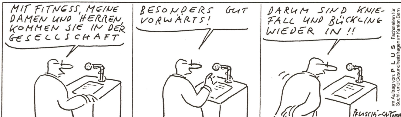
im Auftrag von P. L. U. S. Fachstellen für Sucht- und Gesundheitsfragen im Kanton Bern

Trotz diesen Rückschlägen, scheinen die Berner Verantwortlichen an einer weiteren Planung einer versuchsweisen Abgabe von Heroin und Morphin an Süchtige unter ärztlicher Kontrolle und mit wissenschaftlicher Begleitung interessiert. Doch bis all die Abklärungen und Bewilligungen eingetroffen sind, werden die anstehenden Probleme und die direkt betroffenen DrogenkonsumentInnen einmal mehr von einem zum anderen Ort herumgeschoben. ■