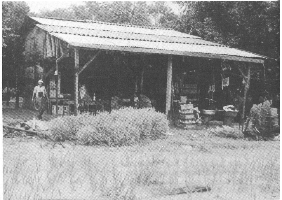
Laden / Restaurant im Chapare.

Als Ergebnis lässt sich festhalten: Der Anbau weitet sich von Jahr zu Jahr aus und erschliesst neue Gebiete (z.B. Beni).