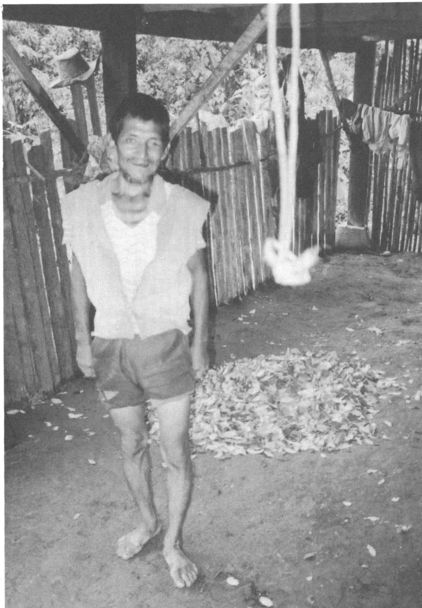
Ein Bauer in seinem Wohnhaus. Im Hintergrund ist die Coca zum Trocknen ausgelegt.

Korruption und Geldwäscherei machen vor den höchsten Etagen der Politik nicht