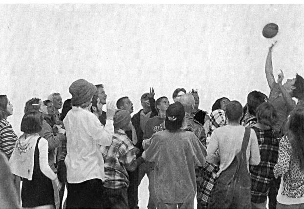
Aus dem Fernsehspot der «Sensibilisierungs-Kampagne Drogen» des Bundesamtes für Gesundheitswesen.