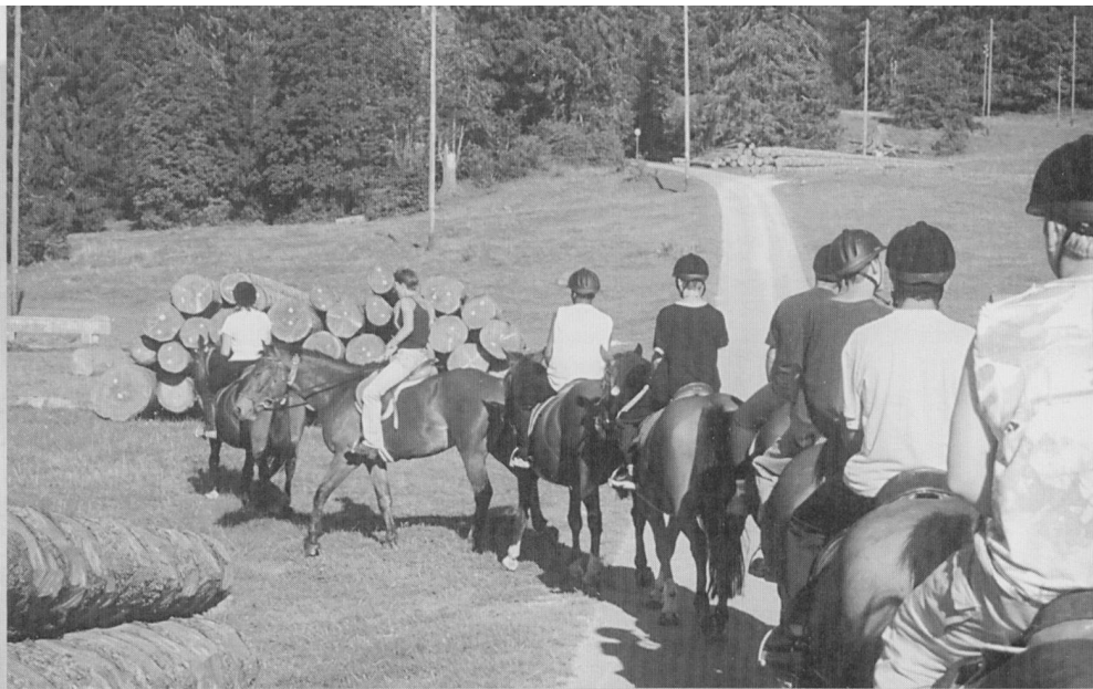
Reitausflug in der ersten Kontaktwoche zu Beginn des Schuljahres.

«Wenn sie es jetzt nicht schaffen, werden sie es nie schaffen.»