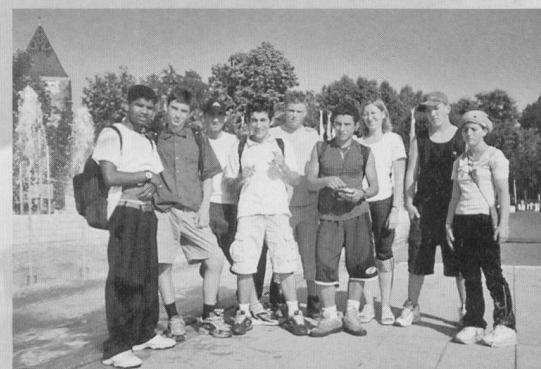
Klassenausflug am Ende des Schuljahres.

Ziel des Classe-atelier ist es, den SchülerInnen das nötige Rüstzeug zu vermitteln, damit sie eine Lehre antreten können oder zumindest einen Berufsweg finden. Während diesem letzten Schuljahr können sie so viele Schnupperlehren machen, wie sie möchten. Selbst wenn ein Junge oder Mädchen in der Schule nicht besonders gut ist, gibt es Arbeitgeber, die sie für eine Aufnahme in die Lehre akzeptieren, wenn sie während der Schnupperlehre zeigen, dass sie arbeitswillig und leistungsfähig sind. Sie können auch ein Lehrvorbereitungsjahr absolvieren oder Nachhilfeunterricht besuchen. «Falls sie mal ‹abstürzen›», meint der Projektleiter, «aber erkannt haben, wo ihre Schwierigkeiten liegen, können sie sich damit beschäftigen. Sie finden heraus, was dagegen zu tun ist, und wie das Hindernis überwunden werden kann. Wenn Sie ein Ziel erreichen wol-