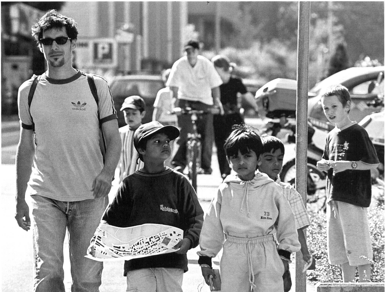
Die Kinderspione schwärmen aus.