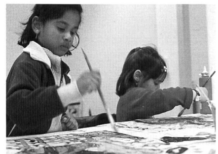
Malen statt Fernsehen.

Derzeit werden die bisherigen Projekterfahrungen zu einem integralen Konzept sozialräumlicher Arbeit mit den 0-18-jährigen Kindern und Jugendli-