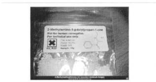
Abb. 2: Eher harmloses Beispiel für falsche Etikettierung.