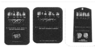
Abb. 1: Dieses Produkt beginnt links als «Party-Pillen». Auf den Verpackungen in der Mitte und rechts ist es zu einem Dünger geworden, aber auch als Dünger scheint es immer noch «höllisch stark» zu sein.