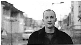
Oliver Susami (Jg. 1978), Fotograf und Soziologe, lebt in Köln. www.oliversusami.de

Eigentlich ist es keine grosse Herausforderung, eine Fotoserie zum Thema Rauchen zu machen. Der Tabakkonsum ist ein allgegenwärtiges Phänomen: Ständig sieht man rauchende Menschen, in jedem Supermarkt und jedem Kiosk werden Zigaretten verkauft und auch Tabakwerbung ist – zumindest in den meisten Gegenden Deutschlands und der Schweiz – selbstverständlicher Teil des Strassenbildes.