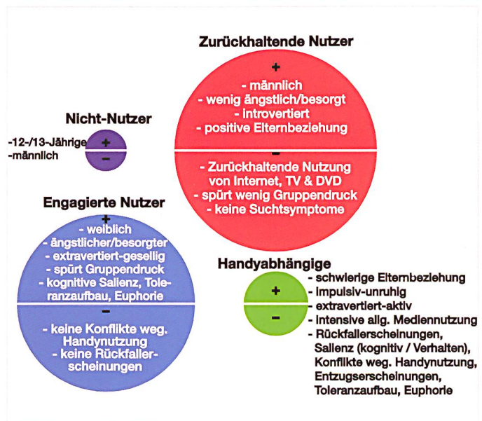
Abb. 2: Typologie der HandynutzerInnen und die wichtigsten Merkmale. 9 Begriffe auf der obigen Seite (+) bedeuten, dass diese Aspekte bei den entsprechenden Nutzertypen jeweils überdurchschnittlich oft auftreten.

Aus den Studienergebnissen lässt sich eine Reihe von Schlussfolgerungen für die Praxis ableiten. So deuten die Befunde darauf hin, dass Verhaltenssucht im Kontext eines Mobiltelefons eine eigene Charakteristik aufweist und nicht eine versteckte Internetsucht darstellt. Allenfalls könnte eine