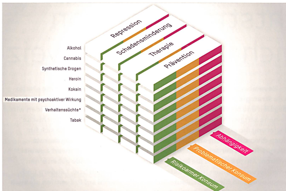
Abb.1: Der Schweizer Würfelmodell. Hinzuzudenken sind die Handlungsfelder Internationale Politik, Koordination, Wissen und Sensibilisierung. 2

Überleben zu sichern und eine medizinische und soziale Grundversorgung anzubieten – inzwischen ein so selbstverständlicher Zugang in der Suchtarbeit ist, dass man diesen nicht mehr unbedingt als Schlagwort auf der obersten Ebene betonen muss. Darüber hinaus wurde der Schweizer Suchtwürfel erweitert, indem die zentrale Basis der Suchtpolitik (ethische, gesellschaftliche, kulturelle, finanzielle und politisch-legislative Aspekte) als Sockel beigefügt wurden, um zu betonen, dass konkreten Rahmenbedingungen eine zentrale Bedeutung in der Gestaltung von Suchtprävention, Suchthilfe und Sicherheit zukommt.