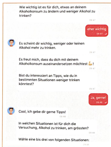
Abb. 2: Ausschnitt aus dem neuen Chatbot-basierten Selbsttest von MyDrinkControl.

Mit der neuen Version von MyDrinkControl, welche derzeit in Zusammenarbeit mit SafeZone und dem ISGF entwickelt wird, macht die Berner Gesundheit einen ersten Schritt in diese Richtung. So wird über eine Web-App ein Gesprächsdialog mit einem virtuellen Coach ermöglicht und ähnlich einer Face-to-Face-Beratung soll bei risikoreich Konsumierenden – basierend auf