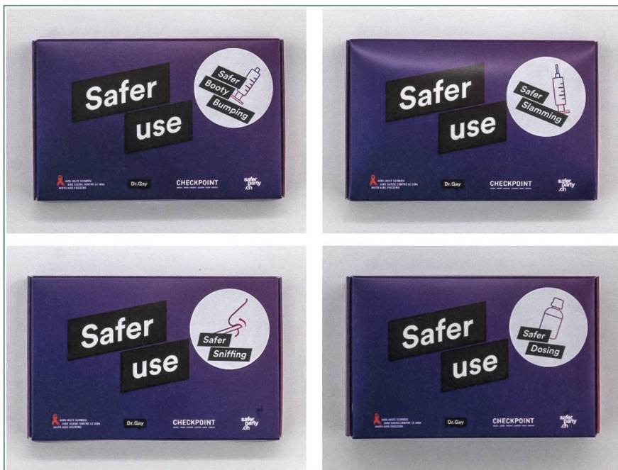
Abbildung 1: Bestellbare Safer Use Kits. 5 https://tinyurl.com/ytu86jbp

Bisher wurde der Thematik Sexualität in Beratung und Therapie keinen grossen Stellenwert beigemessen, da die meisten Fachpersonen aus der Medizin, Psychologie oder der Suchtarbeit kommen. Die Gruppe der Sexolog:innen ist kaum vertreten. Aus sexologischer Sicht ist es unabdingbar diese Beratungslücke