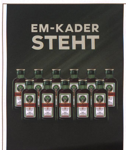
Abbildung 1: Foto-Beitrag vom Instagram-Account des Alkoholherstellers Jägermeister. 1

mit Mitmachaktionen, Gewinnspielen, lustigen Memes und trendigen Schnappschüssen aus dem Partyleben eine junge Zielgruppe. Jägermeister greift in den eigenen Social-Media-Beiträgen beispielsweise öffentliche Ereignisse wie das Finale der TV-Dating-Show «Der Bachelor» oder die Fussball-Europameisterschaft humorvoll auf und setzt dabei gleichzeitig das eigene Produkt in Szene (siehe Abbildung 1). Diese Form der Ansprache weckt Aufmerksamkeit und lädt das Social-Media-Publikum ein, die Beiträge des Alkoholherstellers zu kommentieren und im Freundeskreis zu teilen.