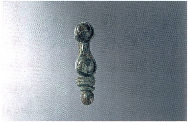
Abb. 79 Sursee, Käppel- matte. Militärische Objekte der zweiten Hälfte des 3. Jh. Oben: muschelförmiges Beschlag als Zierde am Pferdegeschirrriemen (z.B. Stirnriemen), Mitte und unten: Zwei Zier- beschläge für Ledergür- tel mit Gegenknöpfen zur Halterung der Teile. Länge der Zierbeschläge: 4 cm bzw. 2,8 cm.

Während der Riemenendbeschwerer (Abb. 82) wahrscheinlich noch ins 1. Jahrhundert zu datieren ist, sind die kleinen Teile (Abb. 79–81) auf Grund von Vergleichen aus den Limeskastellen in die 2. Hälfte des 3. Jahrhunderts zu verweisen. Die neuesten Untersuchungen zu diesem Thema lehren uns, dass auch in zivilen Siedlungen und selbst in Villen öfters militärische Gegenstände auftauchen können. Ihre Interpretation ist ohne inschriftliche Zeugnisse nicht so einfach. In Frage kommen Veteranen, welche sich in Sursee nach Beendigung der Dienstzeit niedergelassen und ihre erworbene Ausrüstung behalten haben, oder Militärpersonen, welche auf der Durchreise waren und versehentlich Teile ihrer Gürtel oder des Zaumzeugs verloren haben. Es wird aber auch erwogen, dass in den einzelnen vici eine Militärstation vorhanden war, welche Kontrollfunktion über die Transportwege oder über das Gewerbe ausübte.