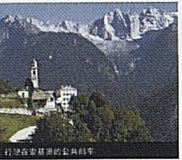
行走在苏黎世街头的公共汽车

铁路 在您乘飞机到达瑞士机场后，只需几分钟您便可顺利换乘火车。苏黎世和日内瓦机场的火车站每小时有