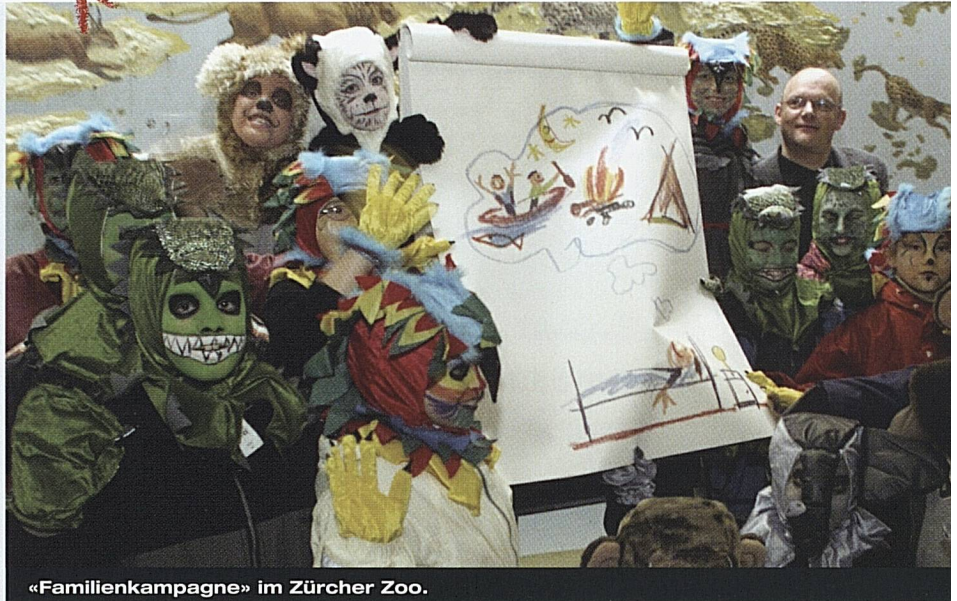
«Familienkampagne» im Zürcher Zoo.

Zu Tieren verkleidete Kinder nahmen die Medien am 13. März 2001 zur Präsentation der Familienkampagne «Platz da für Kinder.» an die Hand. Am Morgen, im Zürcher Zoo, führten die Kinder Journalistengruppen zu den drei Welten Familien-Ferien, Familien-Abenteuer und Familien-Spass, die mit grossen Kinderzeichnungen präsentiert wurden. Am Nachmittag begrüsst eine weitere Kinderschar die Westschweizer Presse im Musée Olympique Lausanne. Die Medienkonferenzen waren ein tolles Erlebnis: Ein wahrer Vorgeschmack eben auf Familienferien in der Schweiz.