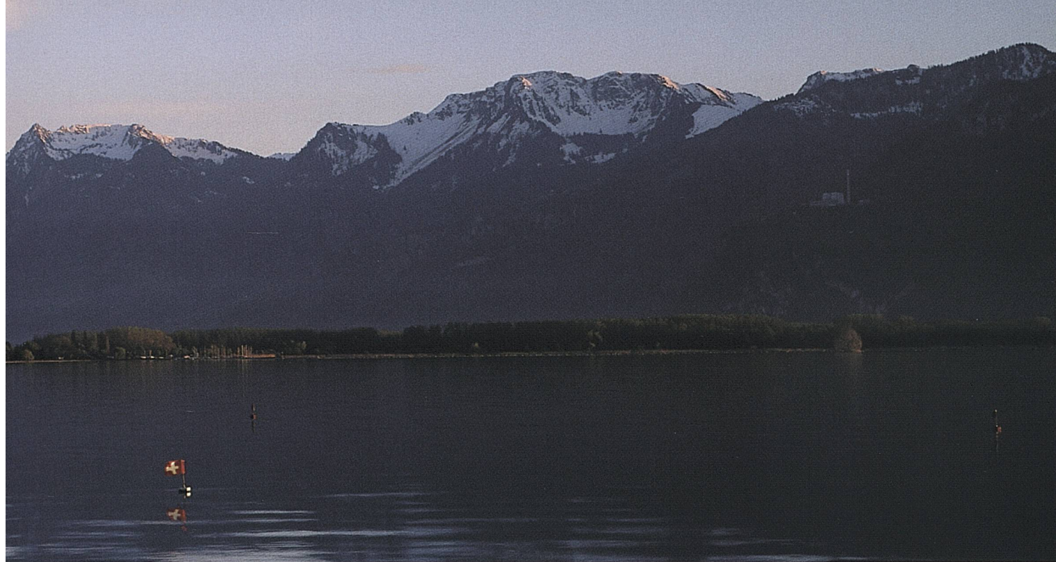
Abendstimmung am Genfersee, Kanton Waadt. Das Schloss Chillon mit Dents du Midi (3257 m) im Hintergrund.