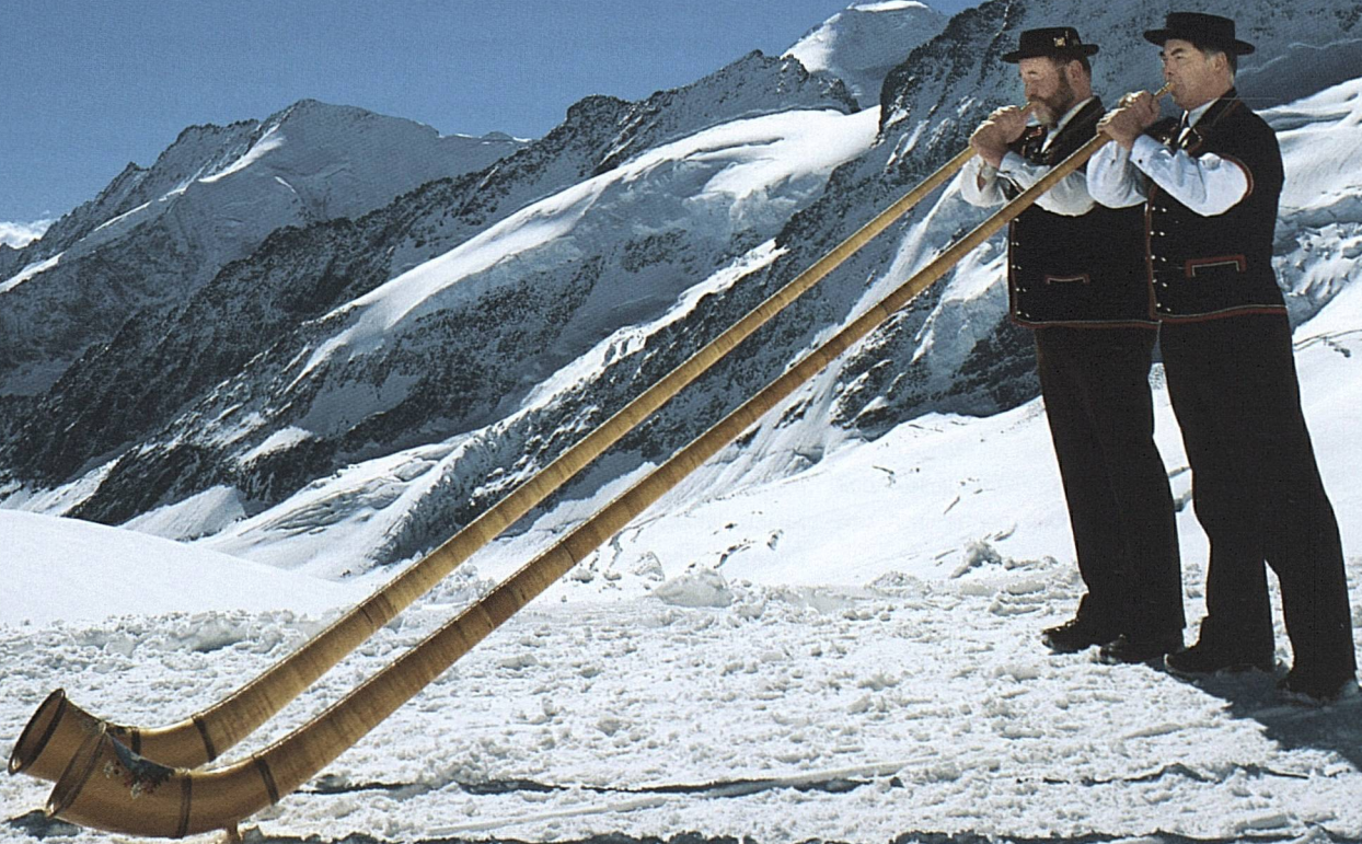
Alphornbläser auf dem Gletscher beim Jungfraujoch (3454 m)

Wirkungsvolle Marketingaktivitäten in einem Spannungsfeld von nicht oder kaum beeinflussbaren Rahmenbedingungen waren gefragt. Markante Zuwächse aus neueren Märkten beeinflussten das Gesamtergebnis erfreulich.