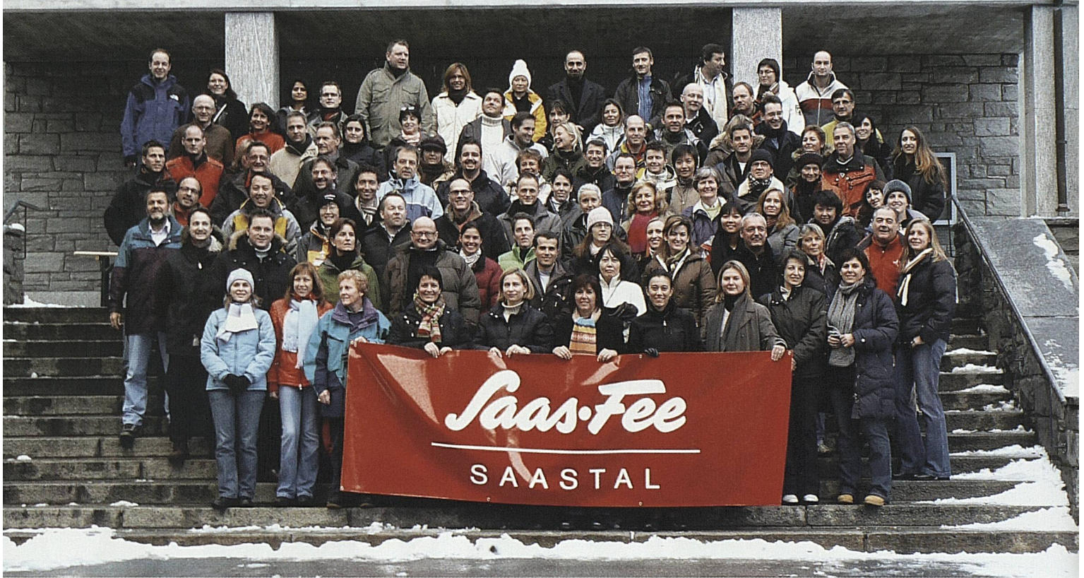
Die internationale ST-Crew trifft sich regelmässig für Workshops und strategische Seminare: dieses Mal in Saas-Fee. L'équipe internationale de ST se réunit régulièrement pour des ateliers et des séminaires stratégiques: cette fois-ci à Saas-Fee.