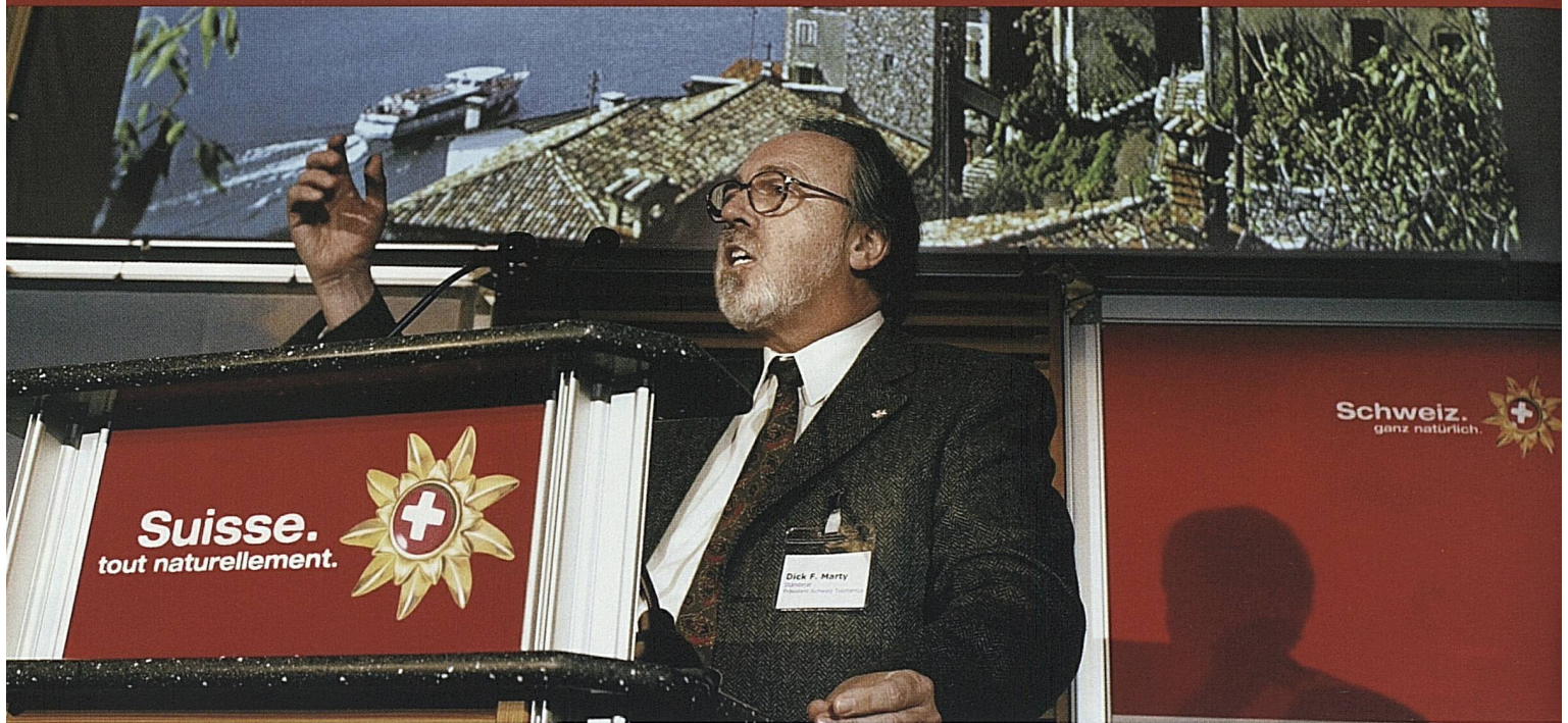
Setzte sich als Präsident während elf Jahren umsichtig und engagiert für Schweiz Tourismus ein: Dick F. Marty. Pendant onze ans, Dick F. Marty s'est investi avec diplomatie et dévouement en qualité de Président de Suisse Tourisme.