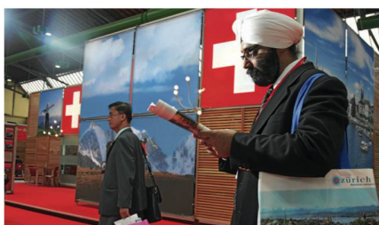
Am STM dabei: Einkäufer aus 45 Ländern. Le STM a attiré des acheteurs de 45 pays.

Organisé tous les deux ans par ST, le STM est le principal événement de promotion des ventes du tourisme suisse. C'est aussi une excellente plateforme de présentation pour la Suisse, destination de voyage, de vacances et de congrès. Les participants ont également l'occasion de visiter la Suisse avant et après le salon.