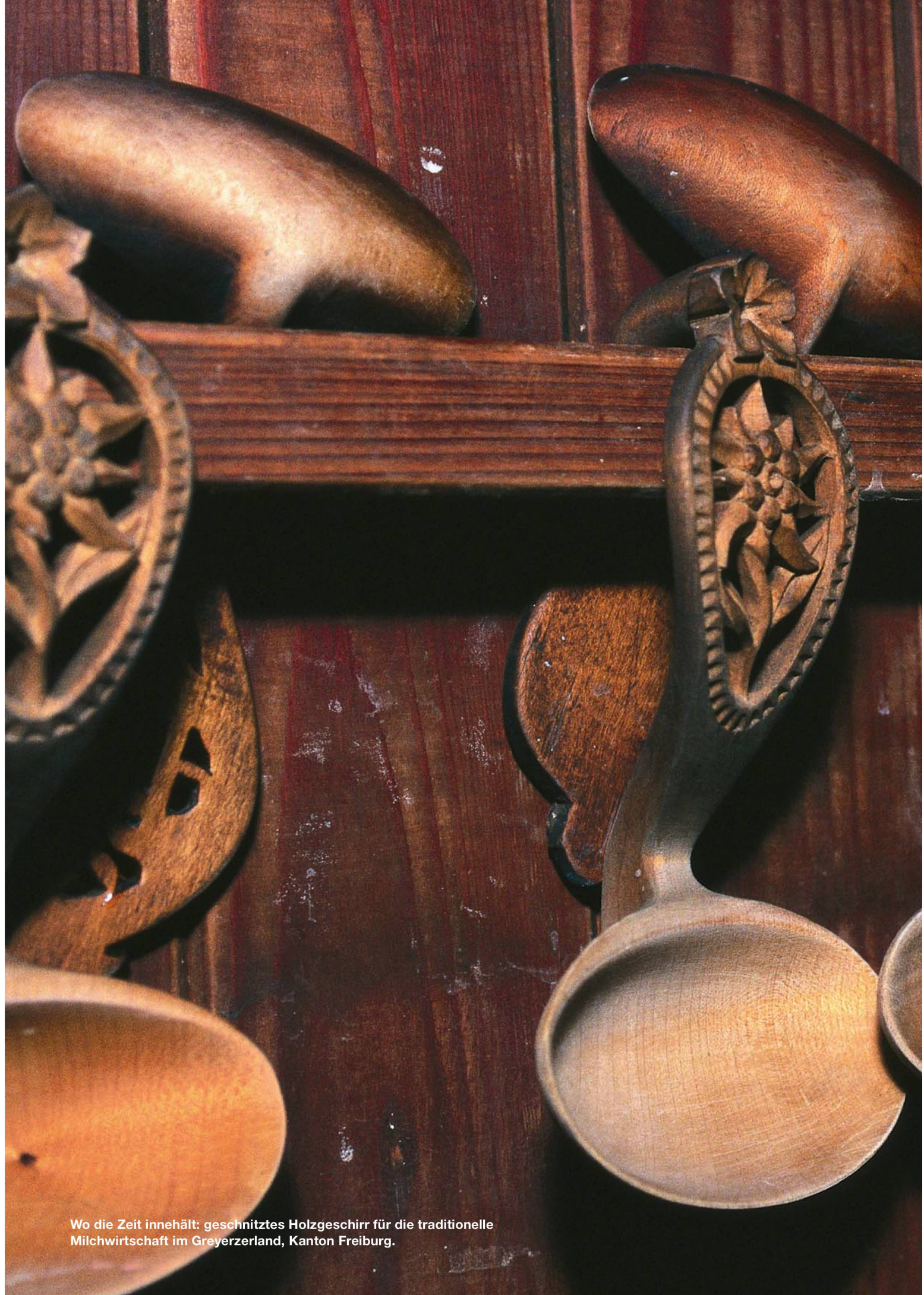
Wo die Zeit innehält: geschnitztes Holzgeschirr für die traditionelle Milchwirtschaft im Greyerzerland, Kanton Freiburg.