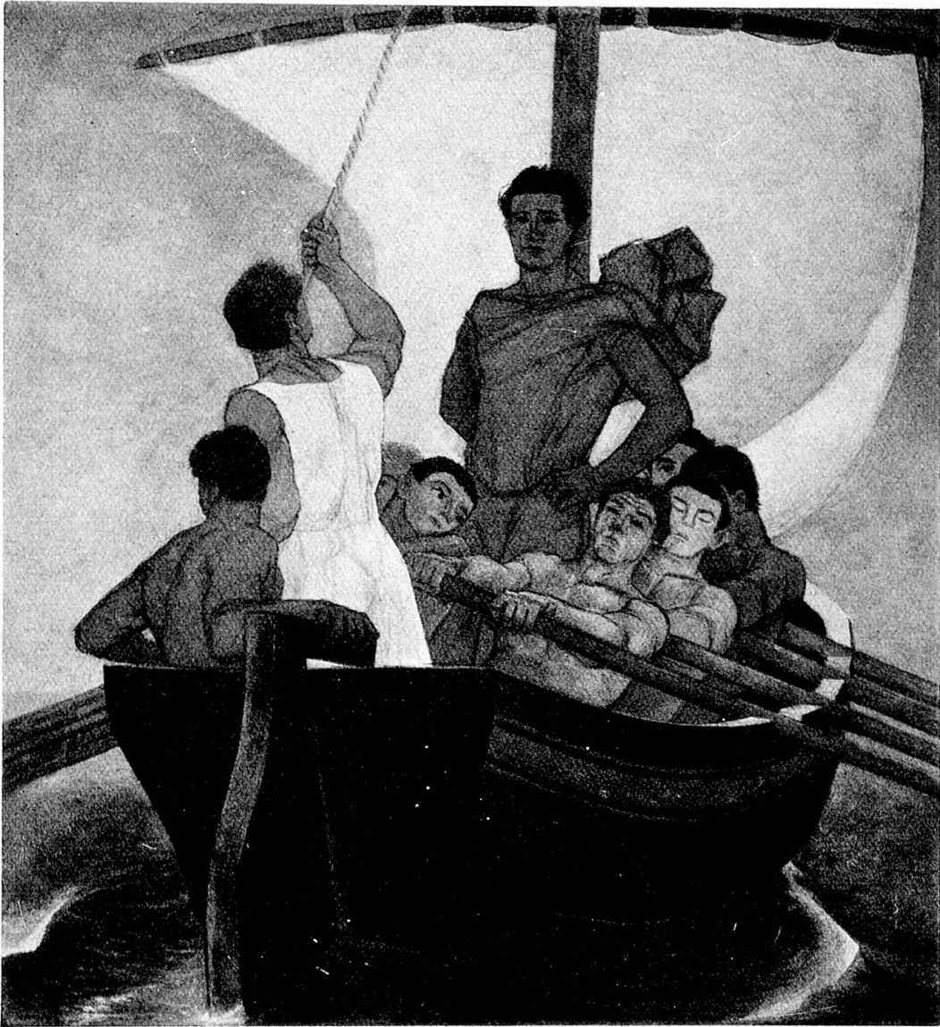
Meerfahrt, Städt. Gymnasium Bern