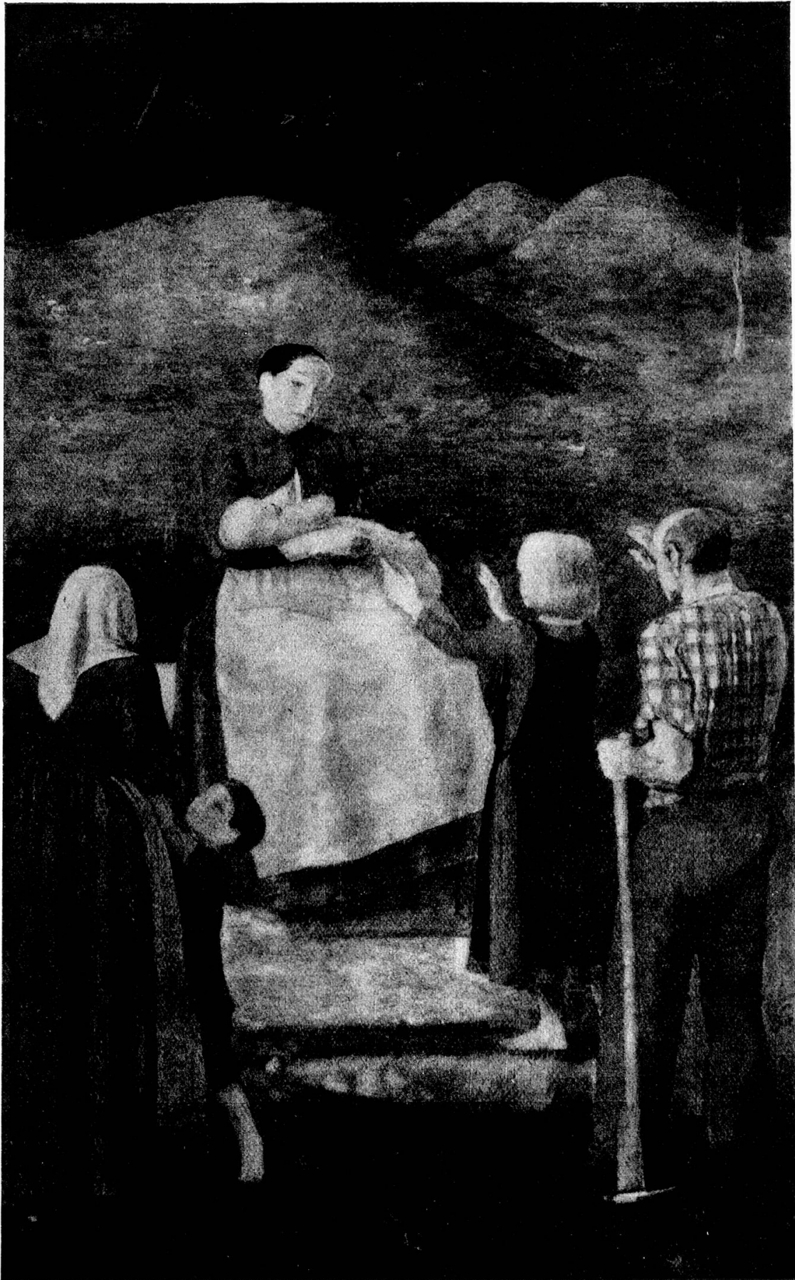
Die Familie, neues Bundesgerichtsgebäude Lausanne