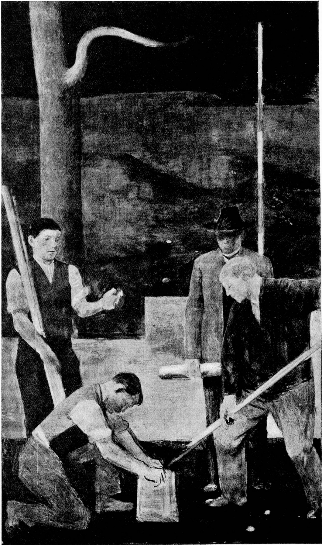
Landmessung, neues Bundesgerichtsgebäude Lausanne