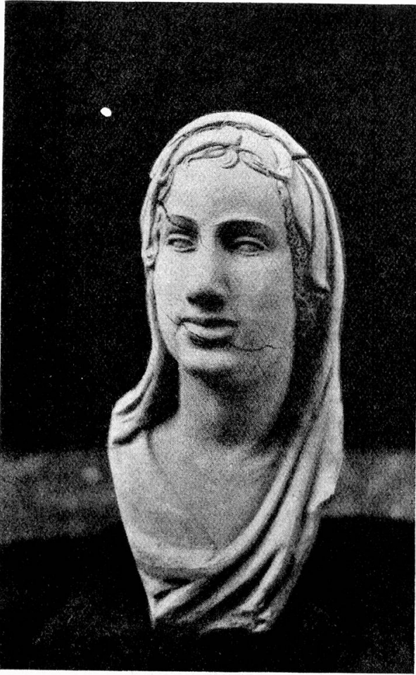
Weiblicher Kopf – letzte Arbeit