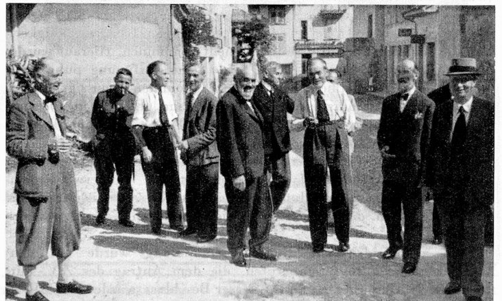
Von den Versammlungen in Estavayer, 4.-5. Juli 1942. Die alten und neuen Zentralvorstands-Mitglieder.