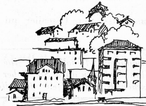
NEUCHÂTEL FAUBOURG DE LA GARE.

Amenuisée et meurtrie, l'architecture reçoit le coup de grâce de l'industrie. La facilité de faire n'importe quoi, n'importe où, les transports de matériaux les plus divers à des distances imprévues, les livres, les revues, les voyages, l'interpénétration des idées, des doctrines et des études, tout contribue à la disparate, au désordre, à la ruine.