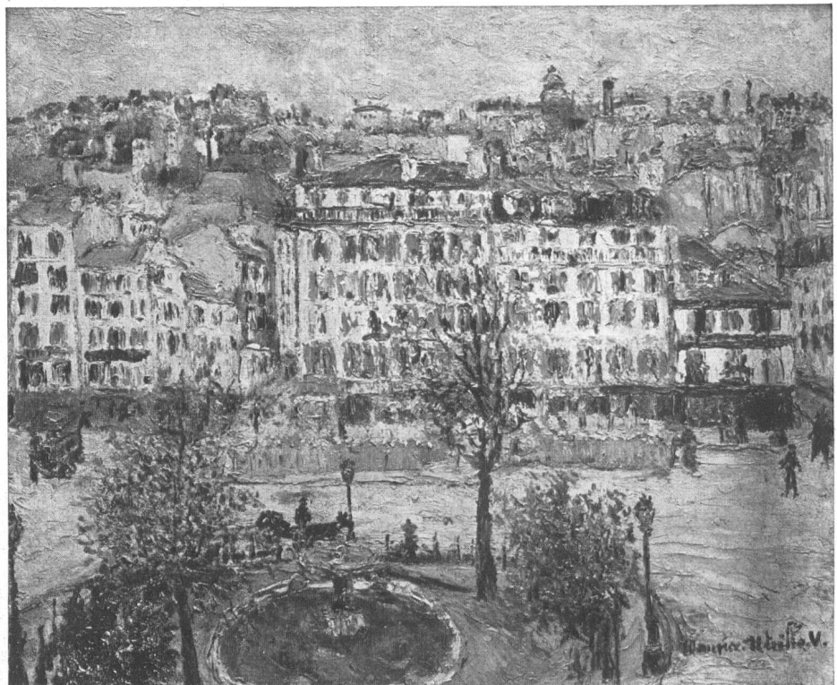
La Place Clichy, 1909/10