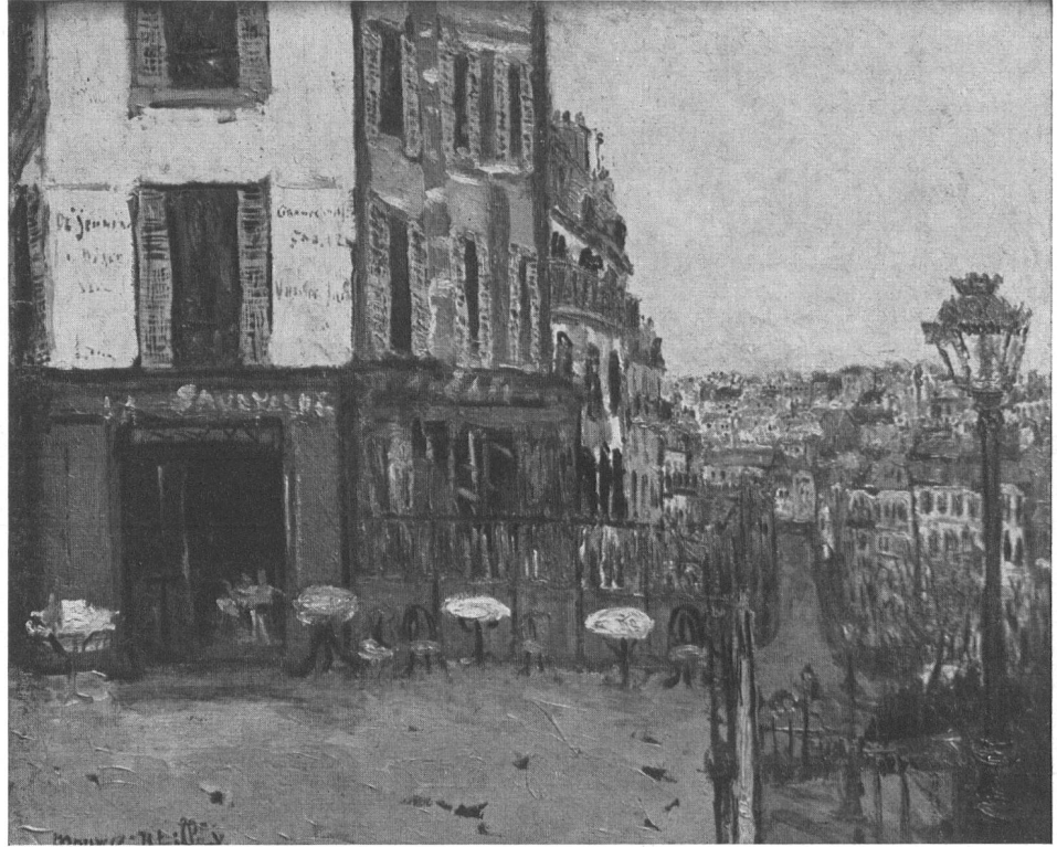
Terrasse de la rue Mulle 1912