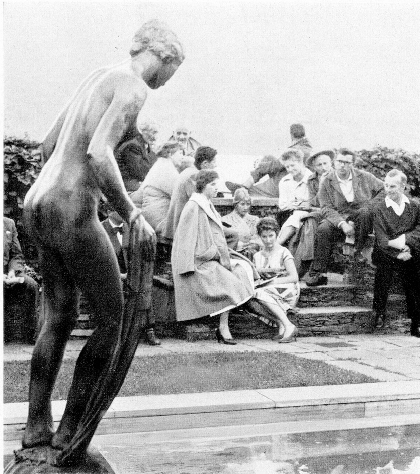
Aufnahme während des Konzerts des Quartetts Monte Ceneri auf der Isola Brissago