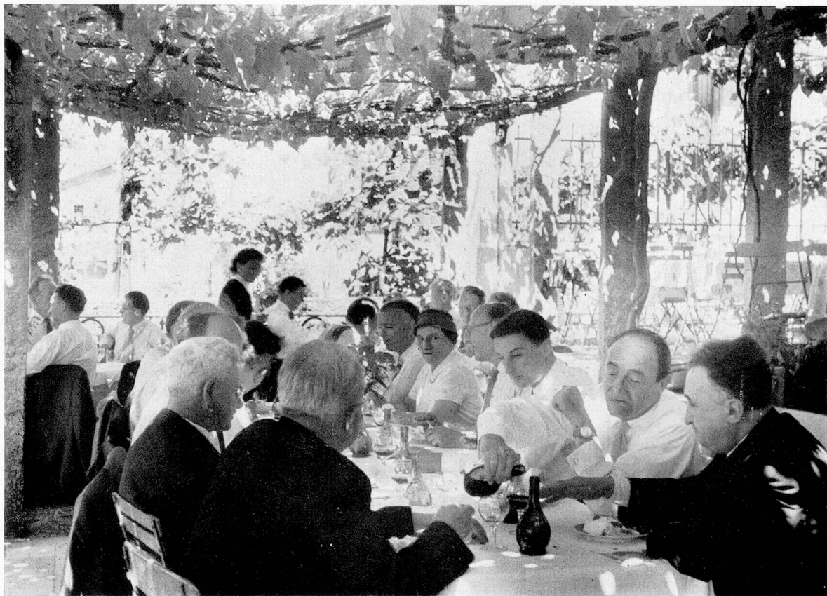
Bankett der Delegierten in Magadino