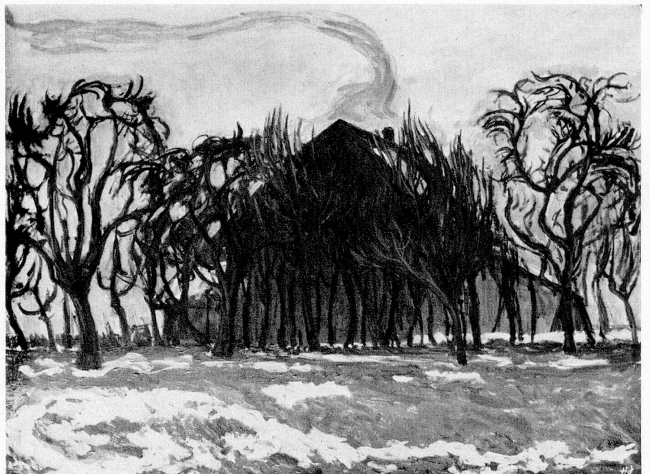
Hans Jauslin: Haus am Abend

An der diesjährigen Generalversammlung unserer Sektion, die wir in aller Stille auf der idyllischen St.-Petersinsel durchführten, wurde uns so sehr bewußt, wie unser