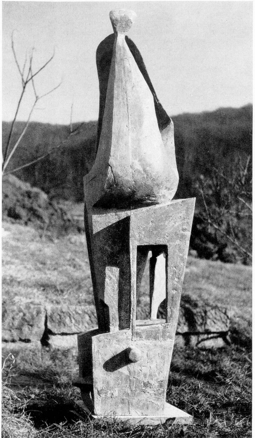
A. Schilling, Arlesheim: Madonna, Höhe 142 cm, 1955