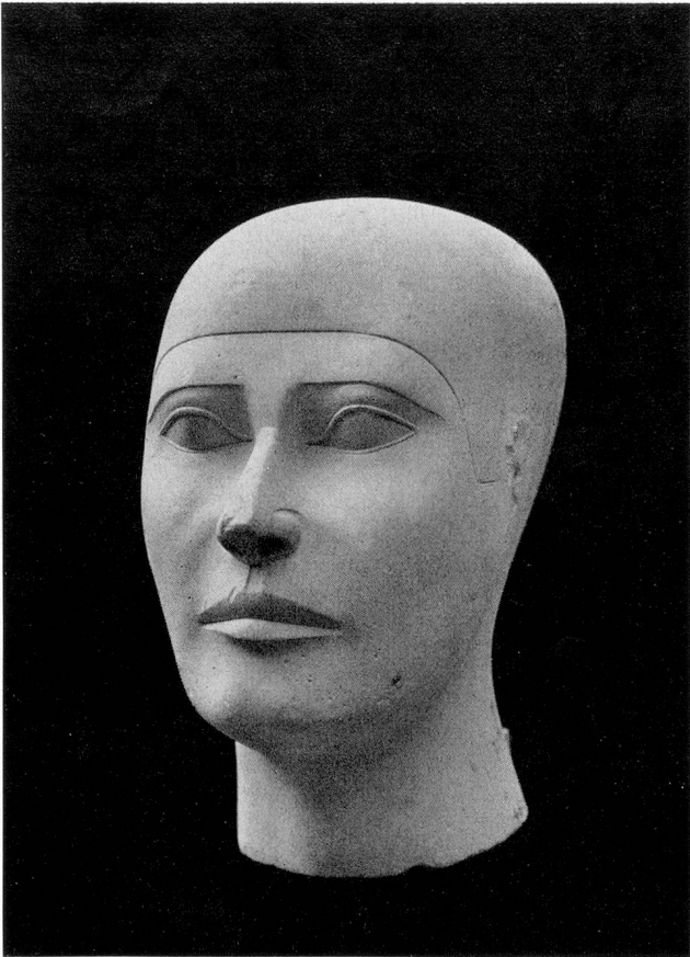
Reservekopf. Giza. IV. Dynastie. Kalkstein, Höhe 19,5 cm. Museum Kairo.