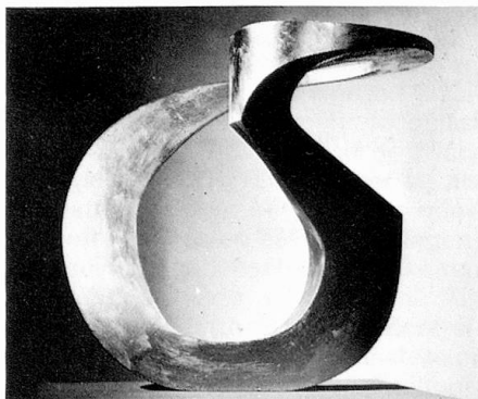
Endlose Schleife, Modell für Monumentalplastik, um 1973 (Bianchi)