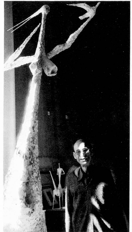
Atelieraufnahme 1974 (Keller)