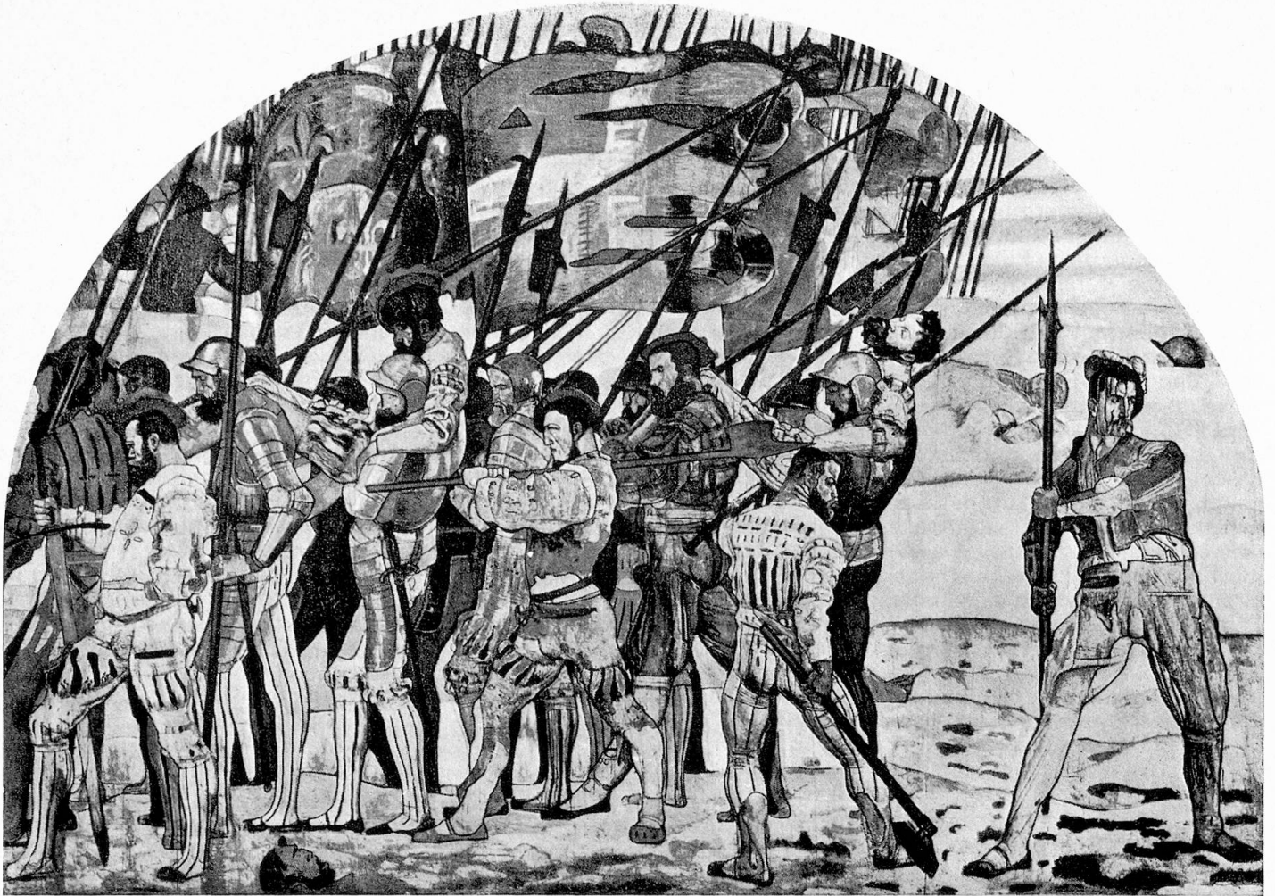
Rückzug von Marignano, Karton zum Mittelfeld. 5. (ausgeführte) Fassung für den Waffensaal des Landesmuseums Zürich

ler überhaupt beschieden war. Der äussere Anlass dazu fand sich in der Vergebung des künstlerischen Wandschmuckes des damals neu erstellten Landesmuseums in Zürich. In der Darstellung jener Geschehnisse folge ich in der Hauptsache dem oben, unter den Quellen erwähnten Spezialbericht des grossen Hodlergegners Angst, dessen Wert als geschichtliche und dokumentarische Grundlage auch dann nicht zu verkennen ist, wenn man, wie ich, in der grundsätzlichen Frage selbst, eine durchaus gegnerische Stellung einnimmt.