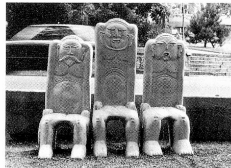
Bruno Weber: Monsterstühle