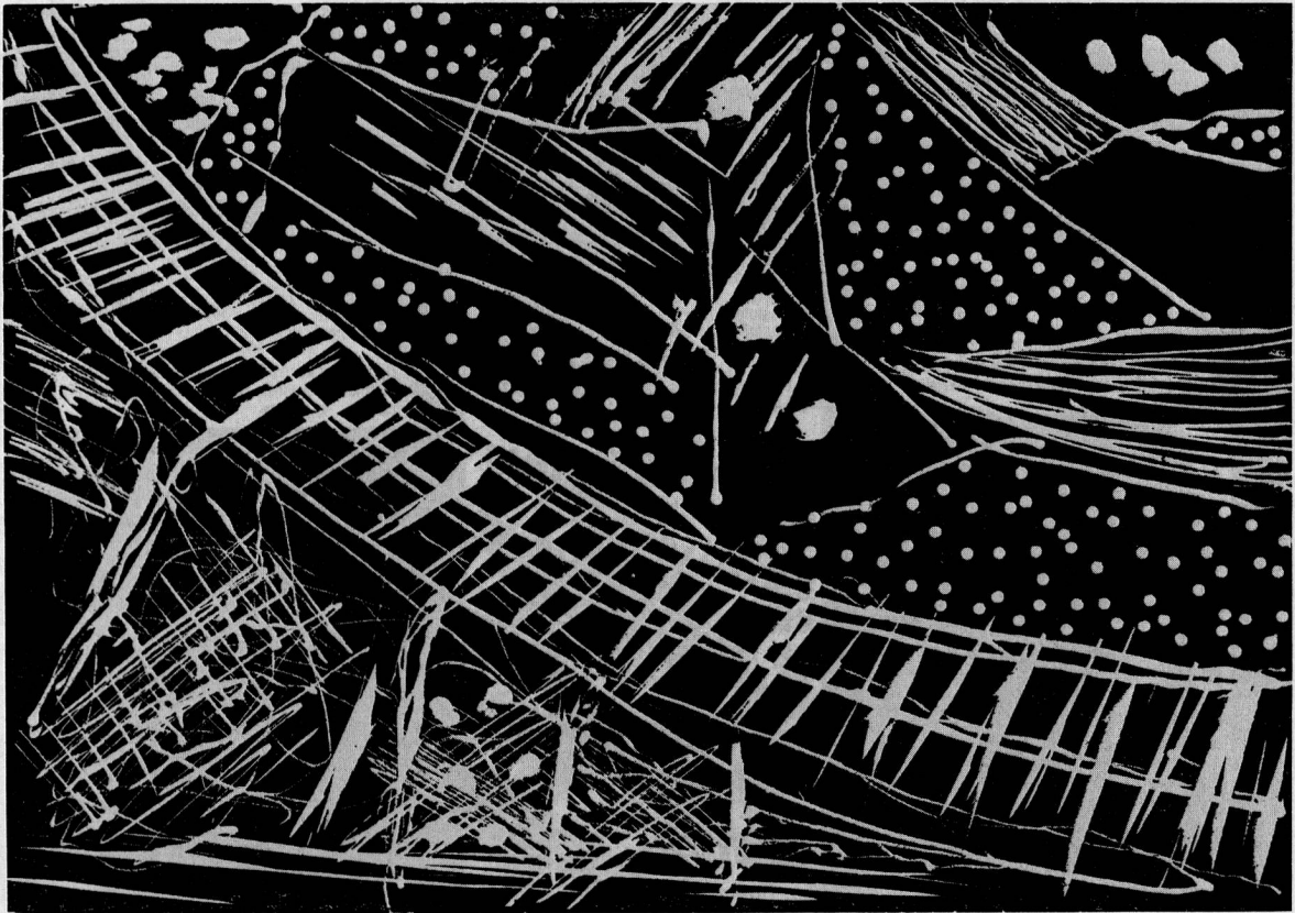
Linolschnitt von Marcel Stüssi