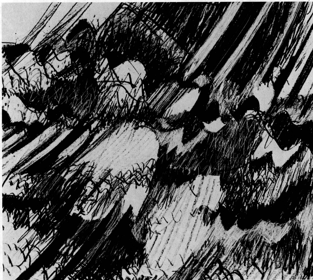
Zinkographie von Elisabeth Stöcklin