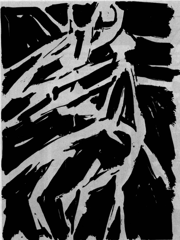
Zinkographie «in Bewegung-live» von Dieter Linxweiler

der Schweiz im Jahr 1974 in einem Diagramm von 1974