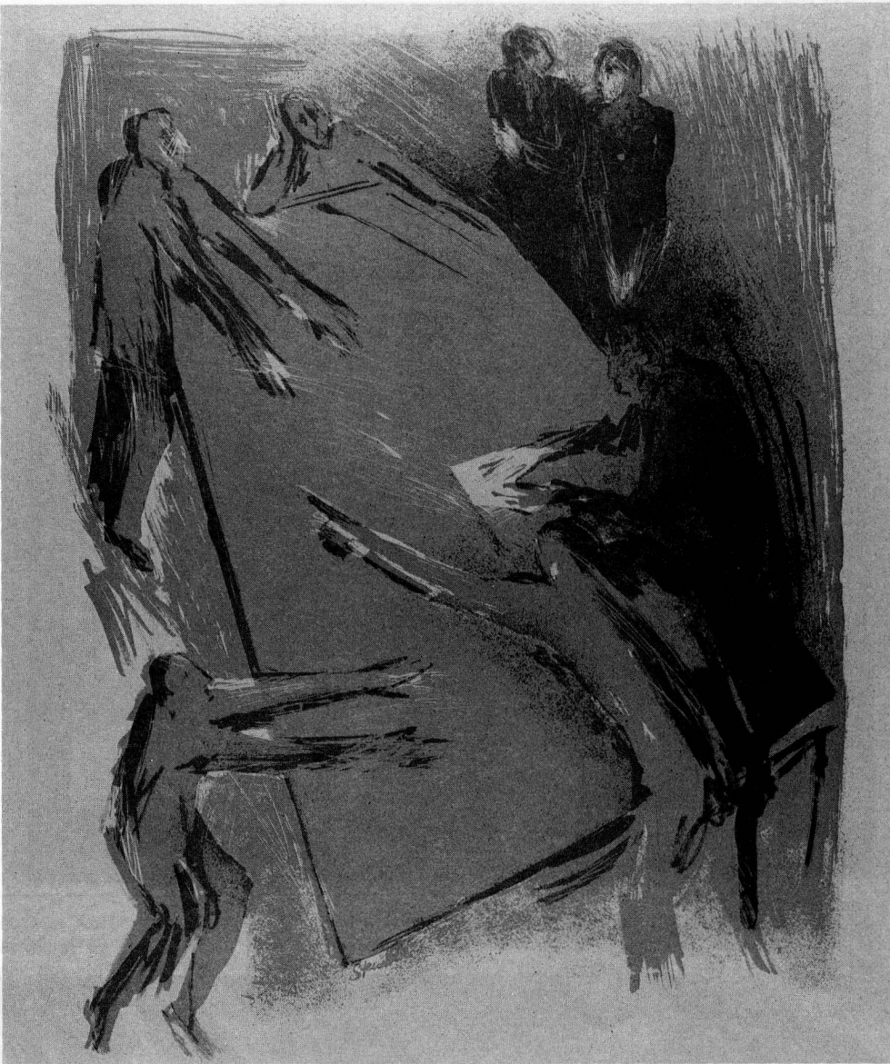
Zinkographie von Beatrice Stuedler

In Zusammenarbeit m GSMBA Sektion sind 1986 eine Sondern (internationale Vier ung und Originalgr Künstler der GSMBA gegeben. Anstelle der übliche Posterentwürfe im der mer Zus im fig