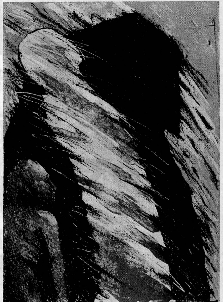
Zinklitho von Barry Cotton