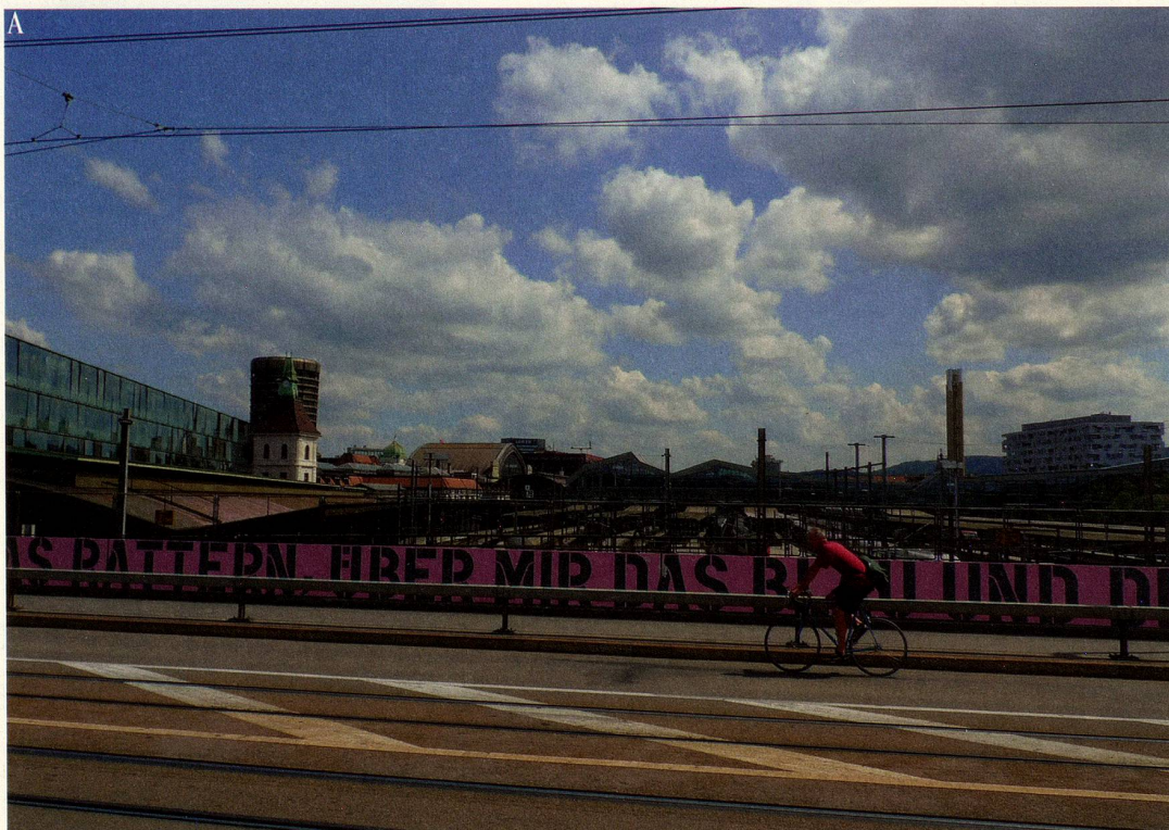
A BrückenPoesie , Neugestaltung Margarethenbrücke, August 2013

L'arte negli spazi pubblici e sviluppo urbano – intersezione tra due compiti trasversali