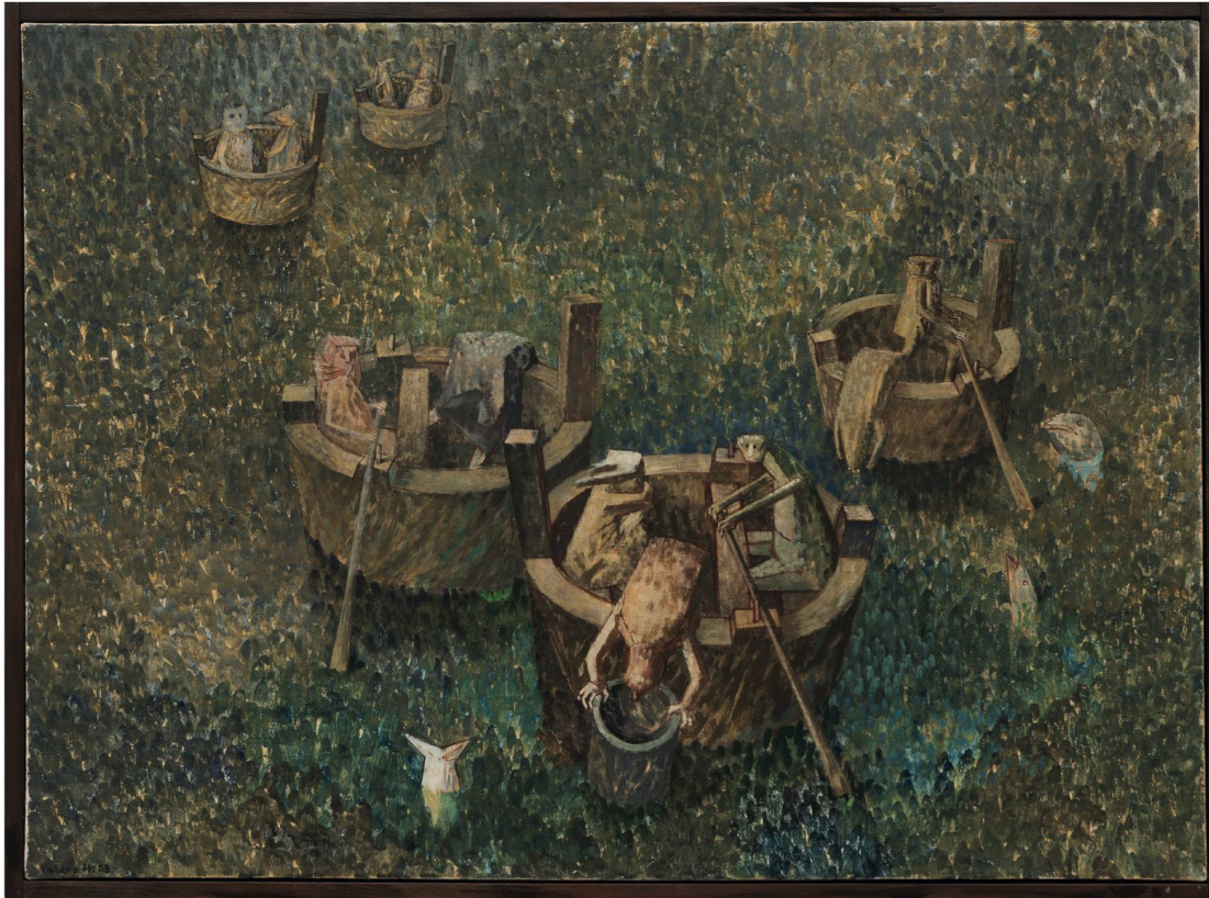
Valery Heussler, Fischfang , 1953, Öl auf Baumwolle, 83 × 115 cm