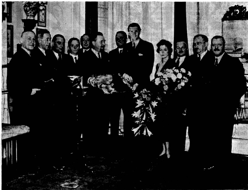
Presentation of an engraved silver-tray, on behalf of members of the Swiss Colony, made by the President of the City Swiss Club.