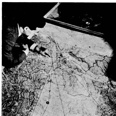
Ing. Meyer an der Verkehrskontrollkarte. Die Positionen der Zürich anfliegenden Flugzeuge sind durch Pappmodelle festgehalten, so dass der Verkehrskontrolleur einen genauen Ueberblick über die Dübendorf berührenden Maschinen hat.

Kollisionsgefahr mit andern Maschinen auszuschliessen. Die in der Luft befindlichen Verkehrsflugzeuge pflegen sich gegenseitig durch ihre Funkstation miteinander über die Route und Flughöhe zu verständigen, doch fehlt ihnen naturgemäss die genaue Uebersicht, wie sie der Verkehrskontrolleur am Boden auf der Verkehrskontrollkarte besitzt. Er wird ihnen also auf funktografischem Wege Weisungen erteilen über einzuhaltende Flughöhe und Geschwindigkeit etc.