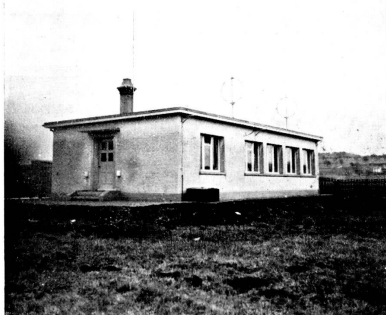
Aussenansicht der Verkehrskontrollstation Dübendorf.