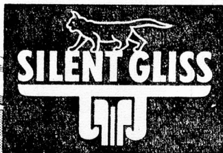
Registered Trade Mark

CURTAIN RAILS WITH NYLON GLIDERS FOR SILENT WORKING