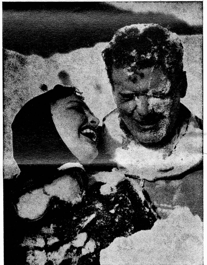
The sparkling fun of snow and sun

occupato della decurtazione dei fondi messi a disposizione della RSI. Il Presidente del Consiglio di Stato ha dichiarato che il Governo ticinese è a conoscenza della questione. Sa che la CORSI è già insorta contro il riparto deciso dal Comitato centrale della Radio Svizzera e ha già inoltrato un ricorso presso l'Autorità di vigilanza, che è il Dip° federale delle Poste e Ferrovie. La questione, ha detto l'on. Celio, ha in verità assunto aspetti che esulano dalle semplici divergenze amministrative, per rivestire