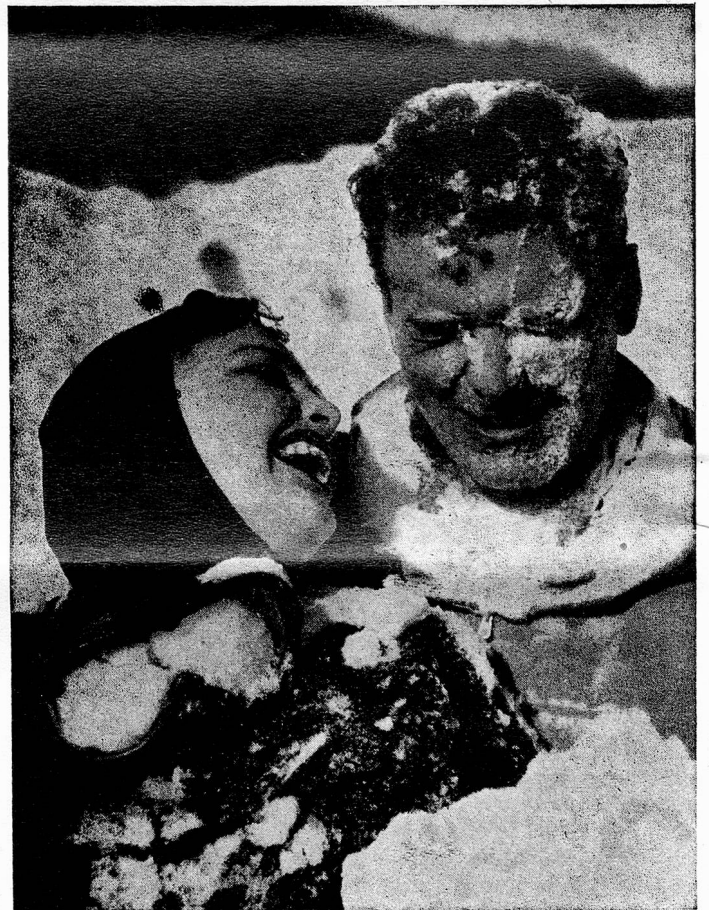
The sparkling fun of snow and sun

occupato della decurtazione dei fondi messi a disposizione della RSI. Il Presidente del Consiglio di Stato ha dichiarato che il Governo ticinese è a conoscenza della questione. Sa che la CORSI è già insorta contro il riparto deciso dal Comitato centrale della Radio Svizzera e ha già inoltrato un ricorso presso l'Autorità di vigilanza, che è il Dip° federale delle Poste e Ferrovie. La questione, ha detto l'on. Celio, ha in verità assunto aspetti che esulano dalle semplici divergenze amministrative, per rivestire