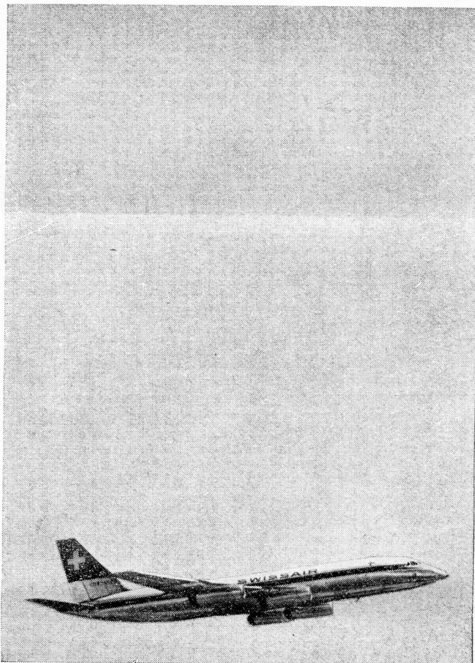
*IN ASSOCIATION WITH B.E.A.

THROUGHOUT THE WORLD ARE SERVED BY BIG, FAST SWISSAIR JETS INCLUDING THE CORONADO—THE WORLD'S MOST ADVANCED PASSENGER JET. DAILY CARAVELLE FLIGHTS FROM *LONDON TO ZURICH AND GENEVA CONNECT WITH SWISSAIR'S WORLD-WIDE JET NETWORK. SWISSAIR SERVICE IS LEGENDARY—PROVE IT FOR YOURSELF NEXT TIME YOU GO ABROAD.