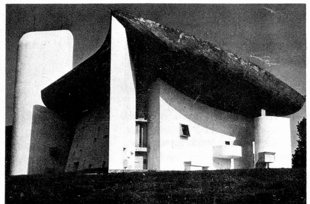
Ronchamp Chapel, France.