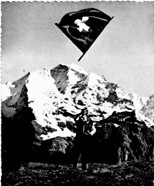
Greetings from Switzerland