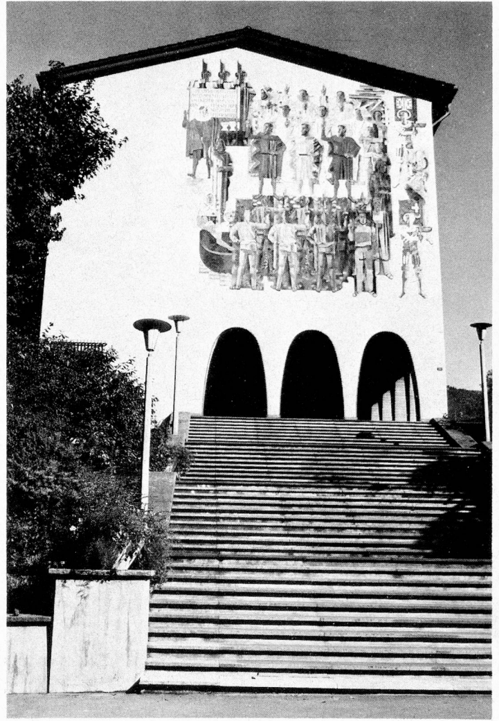
The facade of the Swiss Federal Archive building in Schwyz has a huge mural depicting the swearing of the allegiance. It was painted by Heinrich Danioth in 1936.