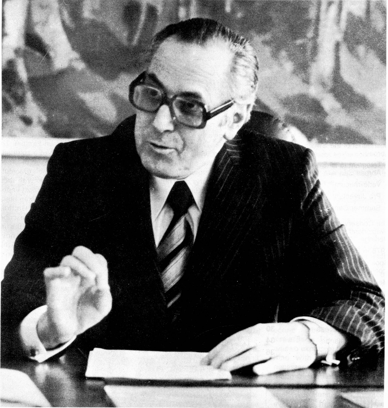
Dr Hans Huerlimann, Federal Councillor, Head of the Federal Department of the Interior, President of the Confederation in 1979

THIS ISSUE CONTAINS OFFICIAL INFORMATION