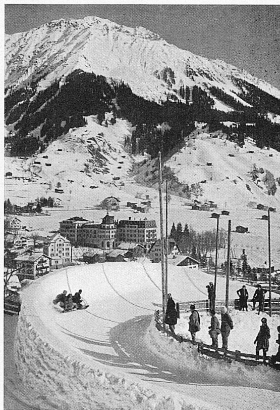
Die Bobbahn in Klosters / La piste de bobsleigh à Klosters