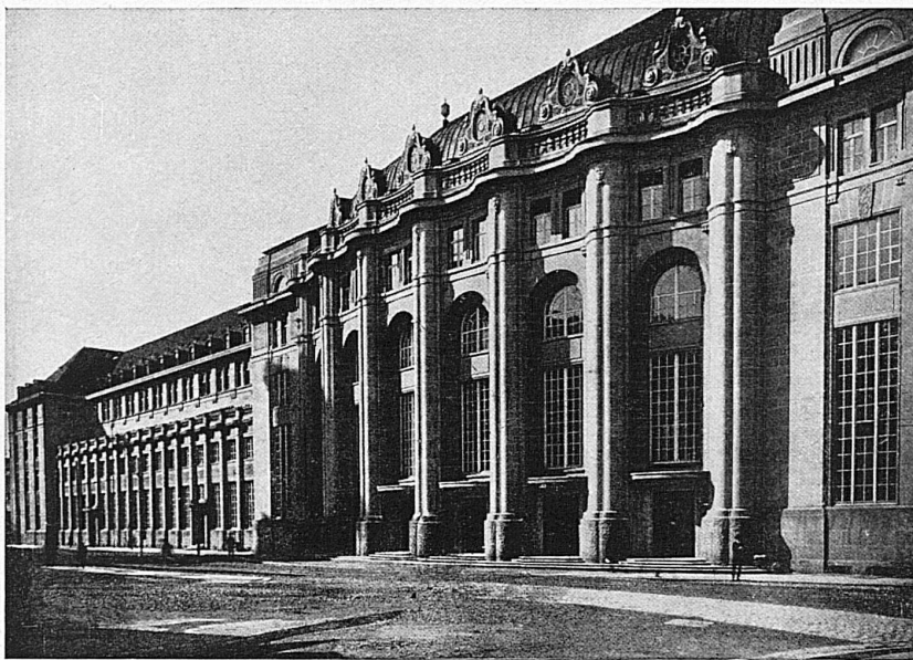
Bahnhof St. Gallen / La gare de St-Gall / La stazione di San Gallo

dintorni meritano anche altrimenti d'essere visitati ed in tutte le stagioni dell'anno. La posizione della città è quanto mai pittoresca: le dolci alture circostanti, specialmente il Rosenberg ed il Freudenberg, invitano a belle passeggiate ed offrono una vista incantevole sulle alpi, le prealpi, la pianura ed il lago di Costanza che, verso nord-est, pare sconfinare nell'orizzonte. La città stessa è ricca di tesori storici